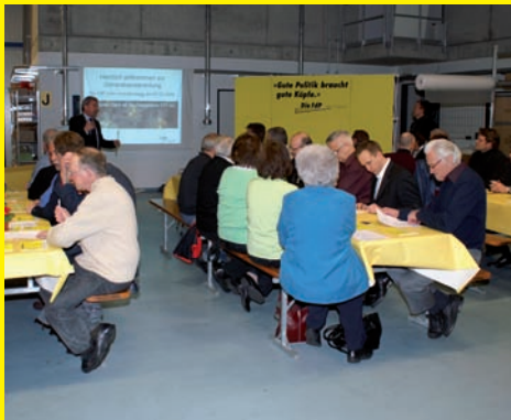
Zu Gast bei Firma STT