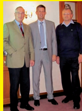
Kompetenz zu aktuellen Themen