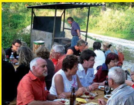
Die FdP Führungscrew einmal anders unterwegs