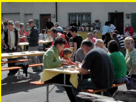
E Guete ...